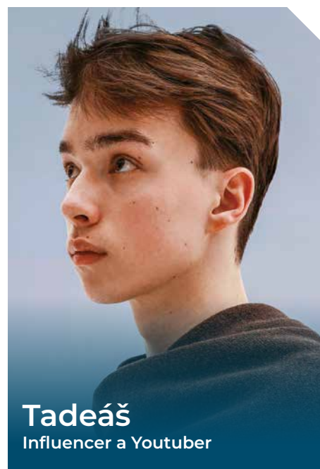
Tadeáš Influencer a Youtuber

Díky této zkušenosti se dnes dokážu lépe přizpůsobit jak studijním, tak pracovním výzvám. ◀